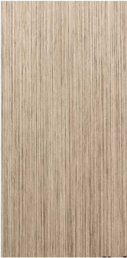
NEWOOD TIGLIO/ROVERE LIME/OAK