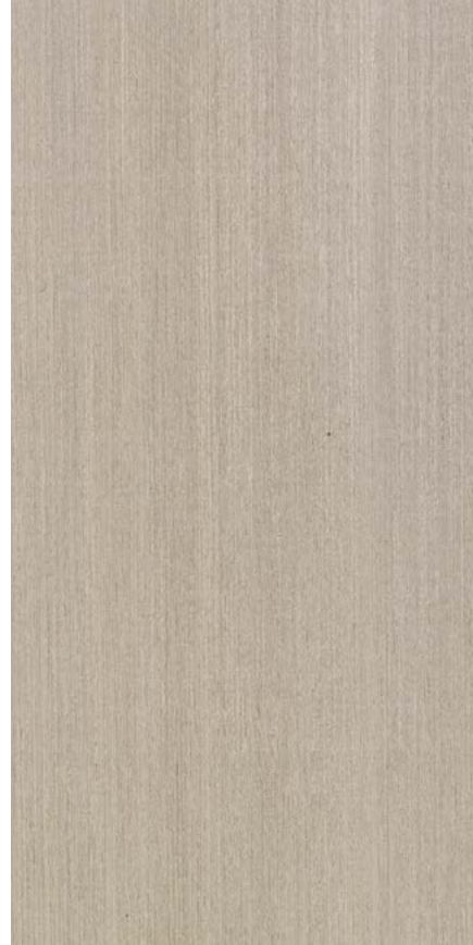
CALEIDOLEGNO TIGLIO / LIME