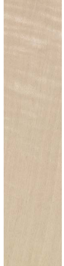
TANGANIKA FRISÉ FIGURED ANEGRE