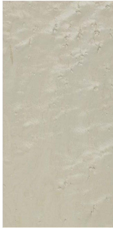
ERABLE BIRD'S EYE MAPLE