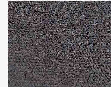
Oxford Trama T004 DWELS