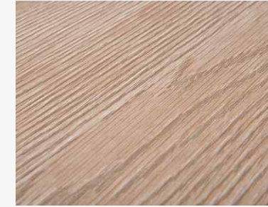
Grand Soho S201 DWELS