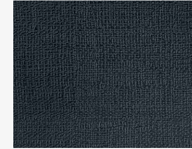
Antracite Trama 3155 DWELS