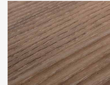
WOW Tundra W005 DWELS