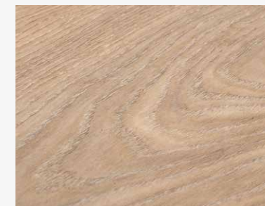
WOW Savana W002 DWELS