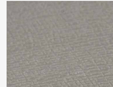
Tortora Trama 3151 DWELS