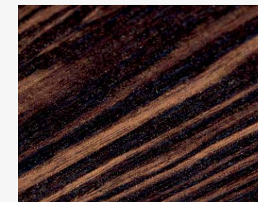
Ebano Axe 4290 DWELS